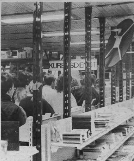
Sjeverbeelden uit de Acco.