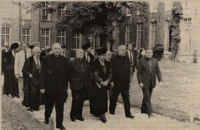
Rustig keuvekend trekt de stoet naar de grote Aula.

Voor een bespreking van de toespraken leze men elders in Veto. Ook hier weer: voor elk wat wils. Vooral bij de toespraak van Dillemans overheerst de indruk: mooi gezegd, maar laten we afwachten wat het zal worden. Frederic Marain