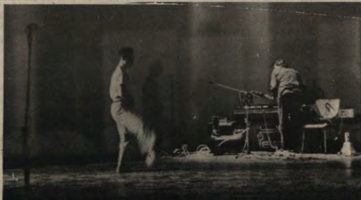
Klapstuk 85 fladdert nu door Leuven. Op de middenpagina van deze Veto krijg je een inleiding op dit dansfestival, maar schrik niet als Jan Fabre uw nachtrust verstoort...