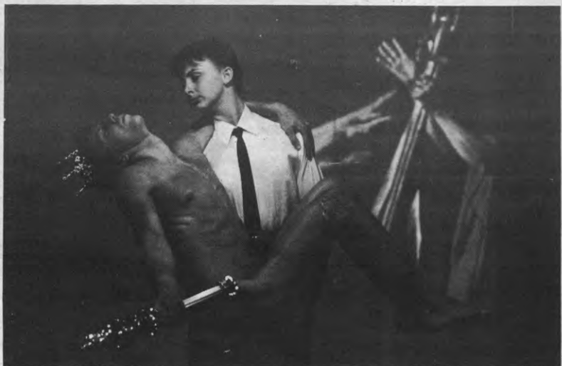
Beeld uit 'De macht der theaterlijke dwaasheden' van Jan Fabre.

Volgende week: Fabre over De Macht en andere dwaasheden.