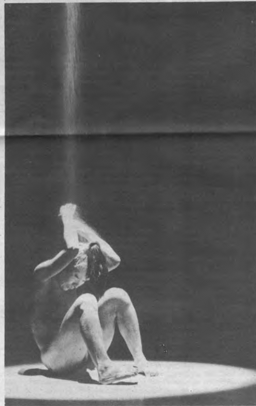
Karlotta Ikeda, een typische eksponent van de Japanse Butoh -dans, gaf een opmerkelijke voorstelling op Klapstuk '83