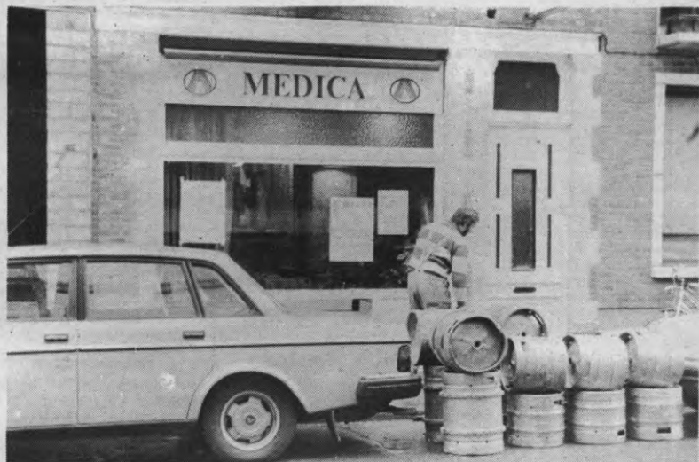
Prijsvraag van de week: hoeveel drinkt de modale medicijnman in spe?

om zelf stilletjesaan in te pakken en huiswaarts te keren. Na het oplossen van het probleem "hoe krijg ik 180 personen in twee bussen van de buurtspoorwegen" keerde de rust in Landgord weer. Een rust waarvan de achtergebleven VTK-presidiumleden profiteerden om languit gelegen op een matras van het late zomerzonnetje te genieten, en om het tekort aan nachtrust in te halen. Het is immers de gewoonte bij VTK dat het presidium nog een dag langer op de bivakplaats aanwezig blijft om dan nog wat uit te rusten enerszijds, maar anderszijds ook om een eerste aanzet te doen naar de werking van het komende jaar.