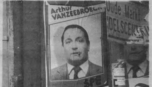
De SPE en haar imago: is Tuur de sigaar of houdt-ie het bij een proletarische halfzware shag?