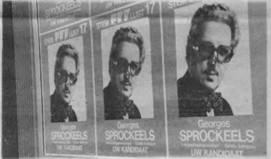
Sprockeels ludiek; Partij, Vrijheid, Vooruitgang: SMURF?