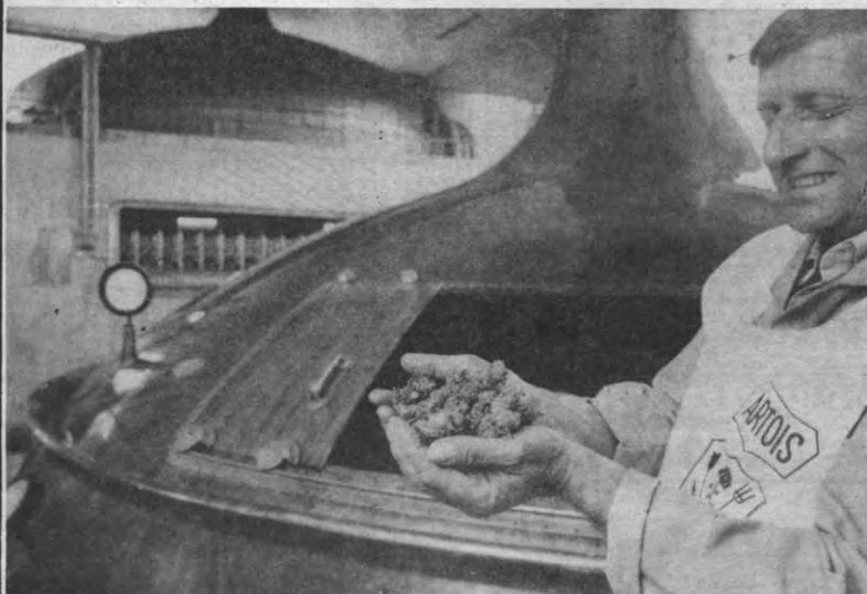
Foto: de hobbellen worden bij het wort gevoegd

Artois, een Leuvense brouwer, die fier is op zijn traditie