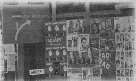
Status quo of ruk naar rechts, enige resterende alternatieven?