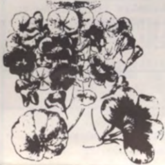
De zwarte emoe.