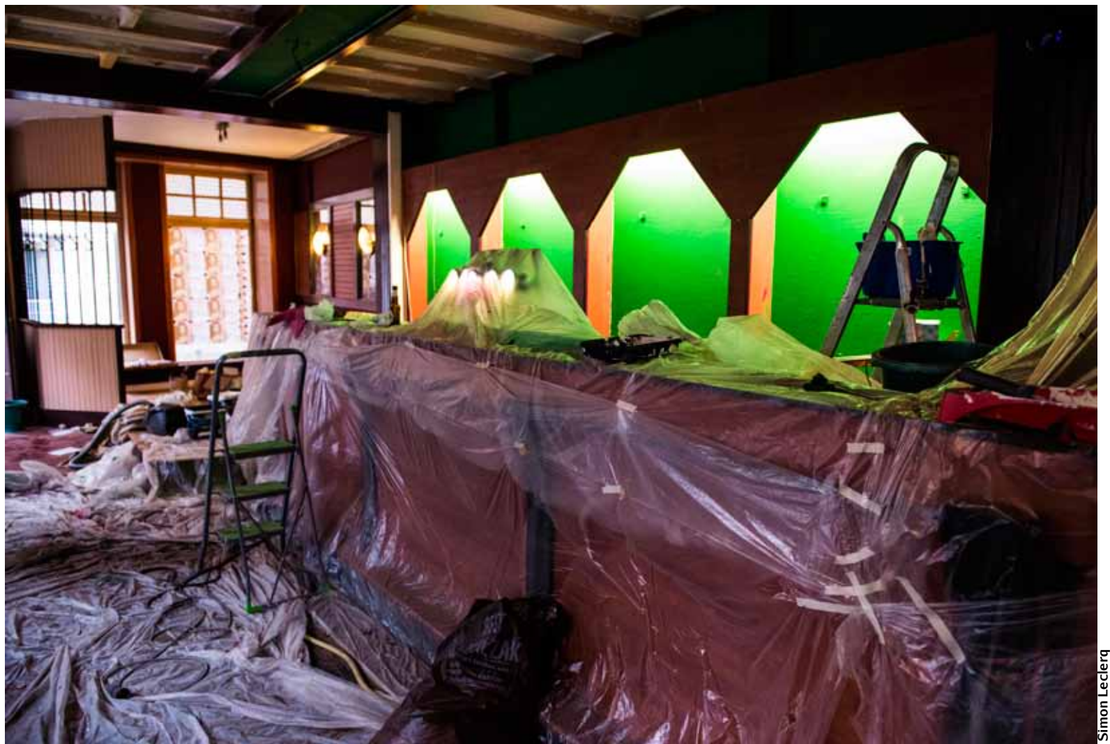
De laatste hand wordt gelegd aan de nieuwe fakbar van Farmaceutica (zie onder).