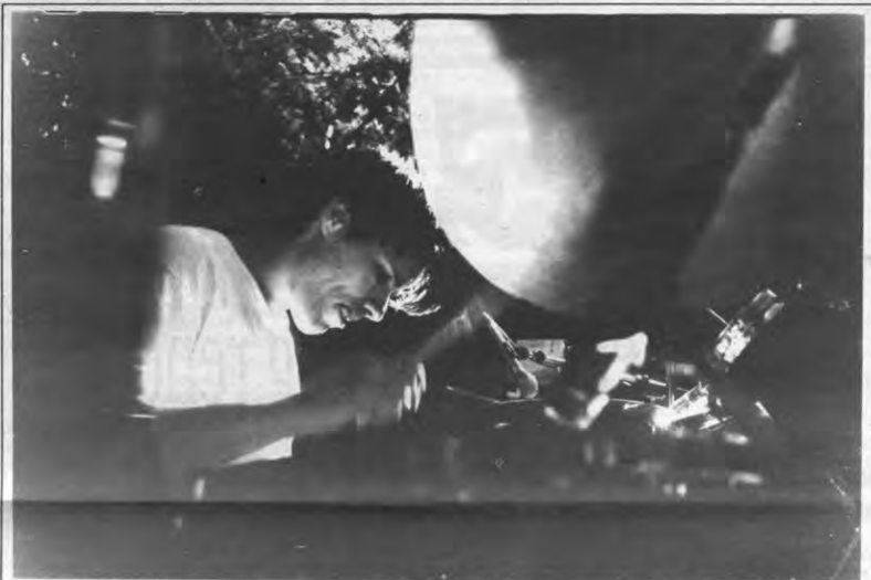
Heksenkruid - Op de laatste dag van Marktrock vonden ook in de tuin van de 's Meiersstraat 5, waar ook de Vetoredactie gevestigd is, enkele optredens plaats, namelijk van het erg pittige Amerikaanse Drive Like Jehu en Die Hexenkräuter uit Köntich, jawel. Organisatoren Kerosene beschouwen het als een antimarktrockstatement. Meer concreet wilde men de monopoliepositie van Marktrock aanklagen: "Zij denken heel Leuven te kunnen opleggen wat er op dat moment gebeurt." Je krijgt inderdaad vaak de indruk dat Marktrock enkel een sponsorkemis is, in de eerste plaats voor L&M. Kerosene voegde zich hiermee bij verschillende andere kritische geluiden die dit jaar over het driedaags festival te horen waren.