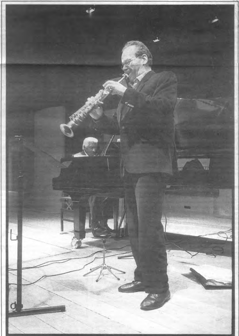
Steve Lacy, vorig jaar nog te zien op Vierkant Muziek

Het Vademecum voor studenten KU Leuven is een realisatie van Kringraad (Loko) en Alfaset cvba 's Meiersstraat 5 3000 Leuven, ☎ 22.04.66