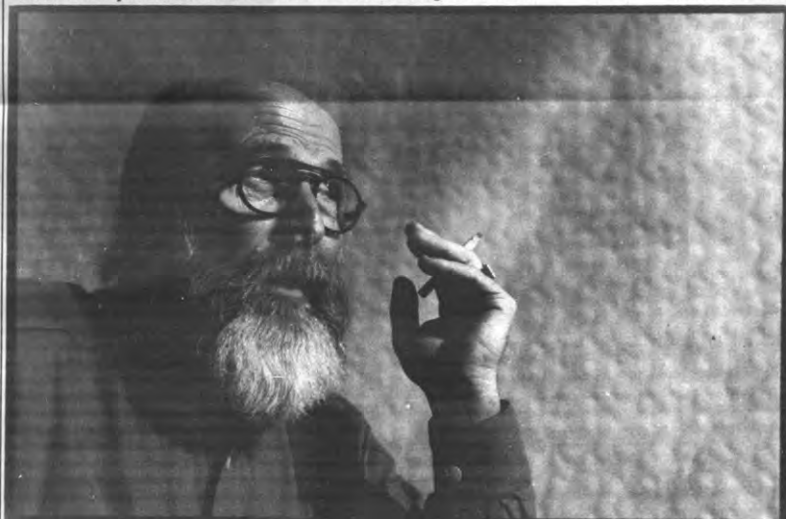
Zeg, kunnen jullie foto's nemen? Ja, wij kunnen foto's nemen.