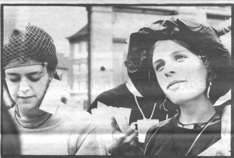
Wegwerprock. Ze zijn er wel erg jong bij, de mensen van Jong Genoeg! Tijdens het Leuvense Marktrockfestival trok de nieuwe geleiding van groen jongerennetwerk Genoeg getooid in vuilnis de straat op, om de festivalgangers te confronteren met de schade die alle wegwerpbekertjes, gadgets en reclamefolders aanrichten aan het leefmilieu. Jong Genoeg wil de jonge Leuvenaars aanspreken die op een creatieve, opbouwende manier willen werken aan een gezonde samenleving.

Eén van de prioriteiten van Jong Genoeg is een leefbare stad, en die komt volgens de groene jongeren door een massaal opgezet commercieel festival in een sterk gekoncentreerd stadscentrum in het gedrang. "De organisatoren laten de binnenstad platton voor hun eigen prestige. Met de inwoners van Leuven wordt helemaal geen rekening gehouden." Jong Genoeg bood op Marktrock vegetarische hapjes en kruidentee aan, als alternatief voor multinational-producten met wegwerppackaging. Hiemeer willen ze iedereen ervan bewust maken dat alle verwoede pogingen om de afvalberg te verminderen door gescheiden huisvuilophaling en recycling weinig effect hebben zolang wij niet op een andere manier gaan consumeren.