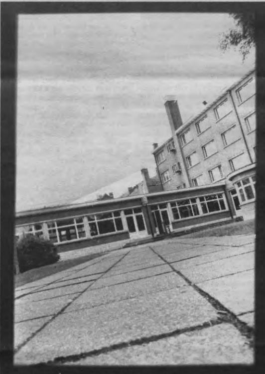
Het Isol, waar Oostafrikanen de Belgische kafeekultuur ontdekken.

Isol heeft eveneens mensen nodig om Engelstaligen de Nederlandse taal bij te brengen zodat de taalbarrières afgebouwd kunnen worden. Isol heeft op dit moment vooral te kampen met een