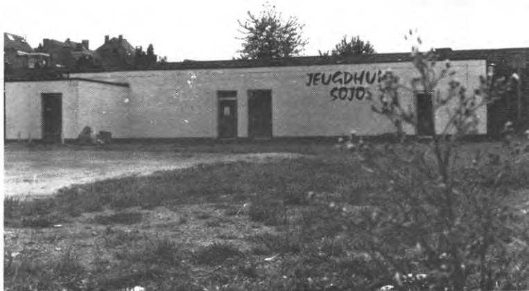
Sojo: hier werd eind juli een mijn gevonden. 'Schroot', volgens het leger.