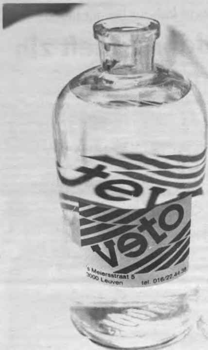
Het tijdperk van de desktop-publishing breekt ook bij Veto aan.

Steven Van Gasse Wie interesse heeft om te komen schrijven, fotografieren, layouten, DTP'en en/of tekenen kan steeds naar de redaktievergadering komen elke vrijdag om 15.00 u of kan gewoon eens binnenspringen op de 's Meiersstraat 5.