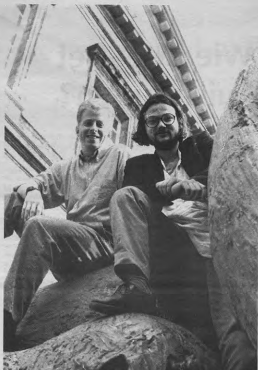
“Een kleine groep gedragen door een grote massa”

Christiaensen: «Het is inderdaad zo dat een kleine groep mensen de zaak behartigt. Zij wordt wel gedragen door een grote massa. Door de manier waarop beslissingen genomen worden in Kringraad wordt de representativiteit gegarandeerd. Wij werken getrap, elke kring vaardigt mensen af naar de raden, waar de discussie gevoerd wordt. Die mensen voeren dan op hun beurt de discussie binnen hun kring. Je kan niet stellen dat