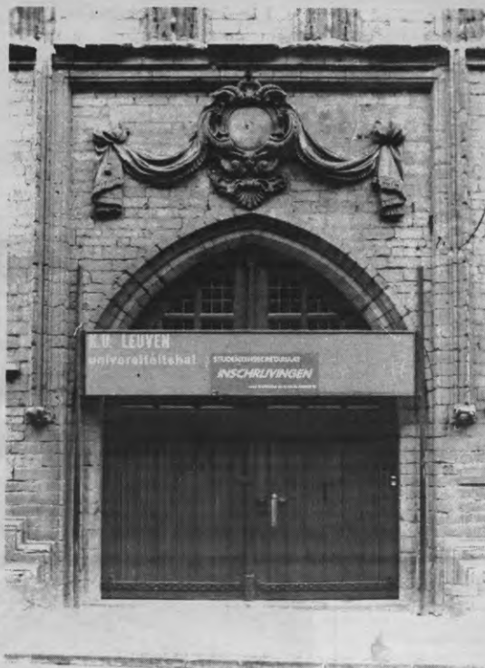
Inschrijvingen: de drempel wordt opnieuw verhoogd.

Op negen juli werd het dekreet dan uiteindelijk goedgekeurd door alle partijen van de Vlaamse Raad, behalve Agalev. Deze laatste konden niet akkoord gaan omdat er geen afbouw verwezenlijkt wordt van het inschrijvingsgeld, aangezien het voor niet-beursstudenten zelfs geïndexeerd wordt, waardoor het dekreet strijdig is met het Uno-verdrag over de Sociale, Economi-