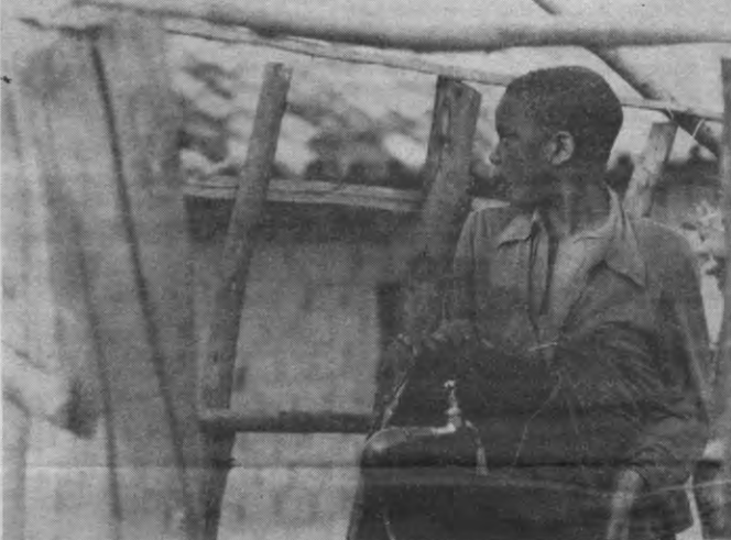
Het samenwerkingsakkoord tussen Vredeseilanden en de plaatselijke organisatie Adehamu leverde tot hertoe al een indrukwekkende reeks verwezenlijkingen op: 27 kilometer weg, een degelijk gezondheidscentrum, spaarbanken en waterputten.

Op het paspoort van de Rwandees staat vermeld of hij behoort tot de 'stam van de landbouwers', de Hutu, of tot de 'stam van de veehouders', de Tutsi. Op die manier kan men nauwlettend controleren of het procentuele aandeel van Hutu en Tutsi in de verschillende maatschappelijke sectoren in overeenstemming is met de algemene verhouding (87% Hutu en 12% Tutsi). Na zijn staatsgreep in 1973 slaagde president Juvenal Habyarimana erin met dit 'principe van evenredige vertegenwoordiging' het eeuwenoude machtsmonopolie van de Tutsi in het onderwys, het bedrijfsleven en de overheidsorganen te doorbreken en het evenwicht tussen Hutu en Tutsi te herstellen. Toch