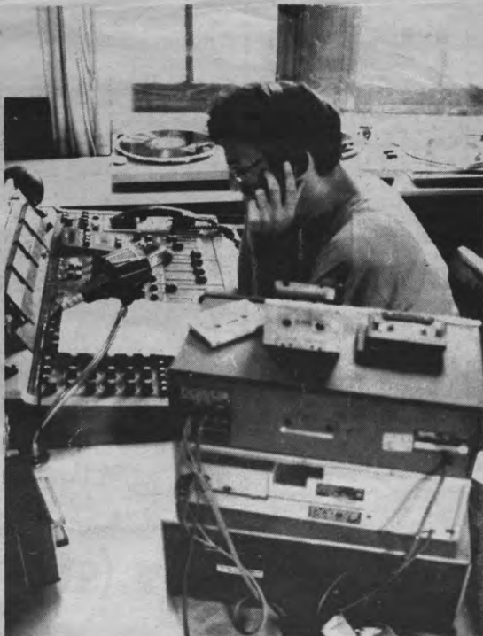
Scorpio kan je ook beluisteren met je koptelefoon op. Helemaal in mono. Iedereen zal jaloers zijn.

verheven en al jaren op regionaal zendbereik aansturen, zich plots het aura van 'lokale radio' aanmeten, is op zijn minst bedenkelijk.