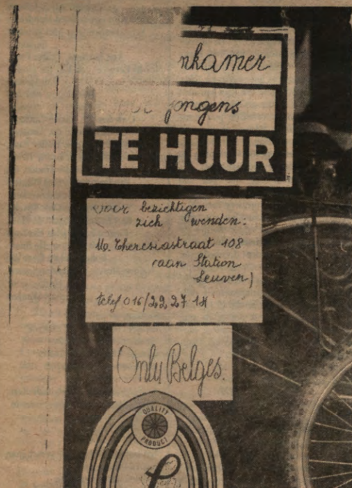
GASTVRIJ - Tot voor kort waren dergelijke bordjes legio in Leuven. Om de wet tegen het racisme te omzeilen, pakken sommige kotbazen het nu iets subtieler aan. Althoewel, wat te denken van... pagina negen?