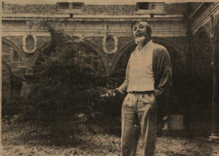
"We zullen blijven vechten voor onze kontrakten en voor eerlijke prijzen, wat ook de markttoestand is".