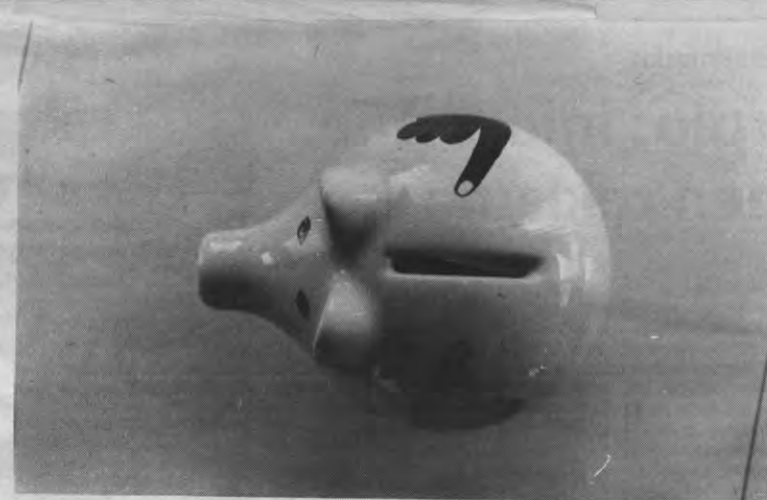
"De oplossing voor het probleem van de studiefinanciering moet komen van een studietoeloo, geïntegreerd in een breder stelsel van basiskomen."

Wie geïnteresseerd is en zelf graag wil meespelen, kan telefonisch contact opnemen tijdens het weekend van 29 en 30 september op het nummer 014/85.13.38. (vragen naar Bert). Voor de meeste instrumenten (niet voor fluit en hobo) is er nog een plaatsje vrij.