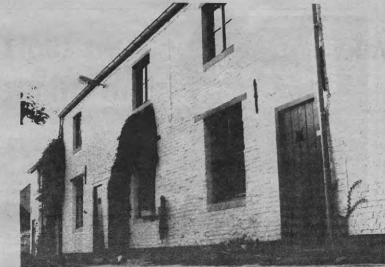
Niet alle kamers hebben een douche, maar dan toch minstens water aan de pomp.

Veto: Elk jaar wordt er een aantal kamers uit de markt genomen, en een ander deel wordt er weer aan toegevoegd. Oudere kamers worden dan verbouwd, opgeknapt. Ook daar is er een evolutie naar luxueuzere, en dus duurdere kamers.