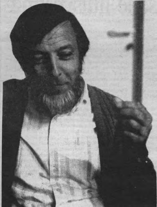
«We moeten kamers toevoegen aan de markt. De academische overheid moet dringend de plannen die ze heeft operationeel maken».