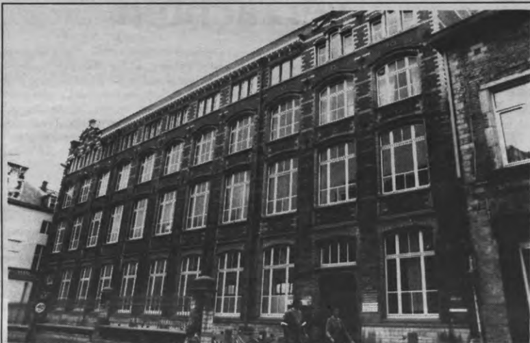
De plannen van het Stuc om het Arenberginstituut in te trekken dateren van 1986. Ze voorzagen in de uitbouw van een groot, prestigieus cultuurcentrum, waarin onder andere een teaterzaal met 340 stoelen, een koffie-restaurant, een kantooruimte en een 'hotel' zou ondergebracht worden. Het Stuc heeft inderdaad nood aan een betere infrastructuur. Als studentencentrum is het evenwel gebonden aan een beperkt project: steun aan jong, vernieuwend talent, cursussen voor studenten en een interessant programma voor een progressief studentenpubliek. Het Arenberginstituut, waarin ook Scorpio huist, kan het Stuc hiervoor de nodige ruimtes bieden. Gelet op het 'alternatieve' karakter van het Stuc, betekent dat echter niet dat het een prestigieuze cultuurtempel van 200 miljoen

Needcompany is gegroeid uit het 'epigonentheater', dat kind aan huis was