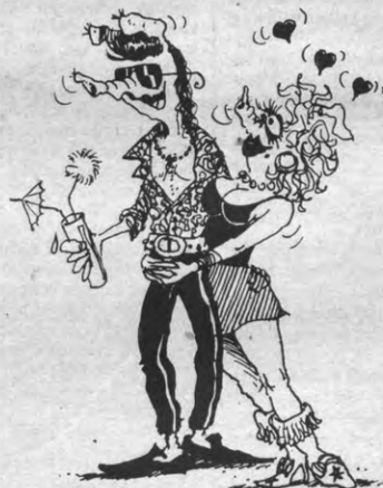
JOHNNY & MARINA

Ondertussen voeren de andere vrije radio's, die uitgegroeid zijn tot grote commerciële zenders, actie tegen de invoering van reclame op de BRT-radio. In advertenties wordt beweerd dat het 'lokale radioleven' daarmee dreigt gebroken te worden. Dat de vrije radio's die de ketenvorming tot de norm hebben