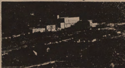
Worden de omwonenden geïnformeerd?