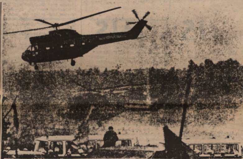
Garleben. De ontruiming van het anti-atoom-dorp.

De professoren van T.W. stellen in hun rapport dat het grote publiek vaak onvoldoende of zelfs verkeerd geïnformeerd is of volledig onwetend nopens een aantal belangrijke aspecten van de kernenergieproblematiek. Akkoord maar anderzijds kunnen deze men-