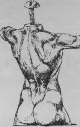
VETO: Waar liggen de problemen?

M.B.: Het probleem is niet alleen de informatie, maar vooral dat jonge mensen, zelfs als ze kennis hebben over anti-konceptie, ze niet toepassen. Er zijn daar een heleboel factoren die de beslissing tot het gebruik van anti-konceptie kunnen afremmen: valse verwachtingen, schrik van thuis, onbewuste motieven vanuit de opvoeding, uit ervaringen... Er kan heel wat meespelen in het feit dat mensen zeer slecht aan anti-konceptie doen.