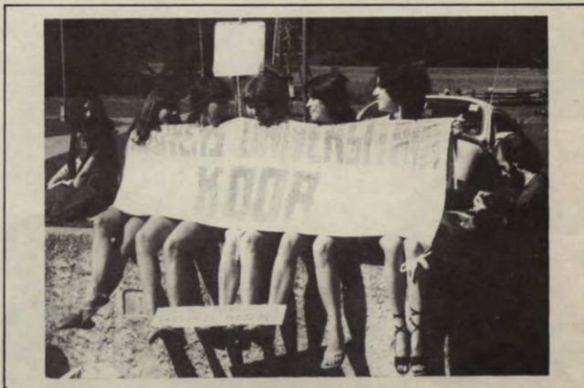
Werkgroep : Het Leuvense Universitair koor

de leden verwacht wordt, heeft ook in min of meerdere mate een vormende functie. Bovendien blijkt duidelijk dat er een behoefte is aan deze werkgroepen: er is een sterke aangroei van de bestaande werkgroepen en er is nog steeds vraag naar nieuwe. Wij staan steeds open voor nieuwe initiatieven, dus heb je voorstellen spring gerust binnen.