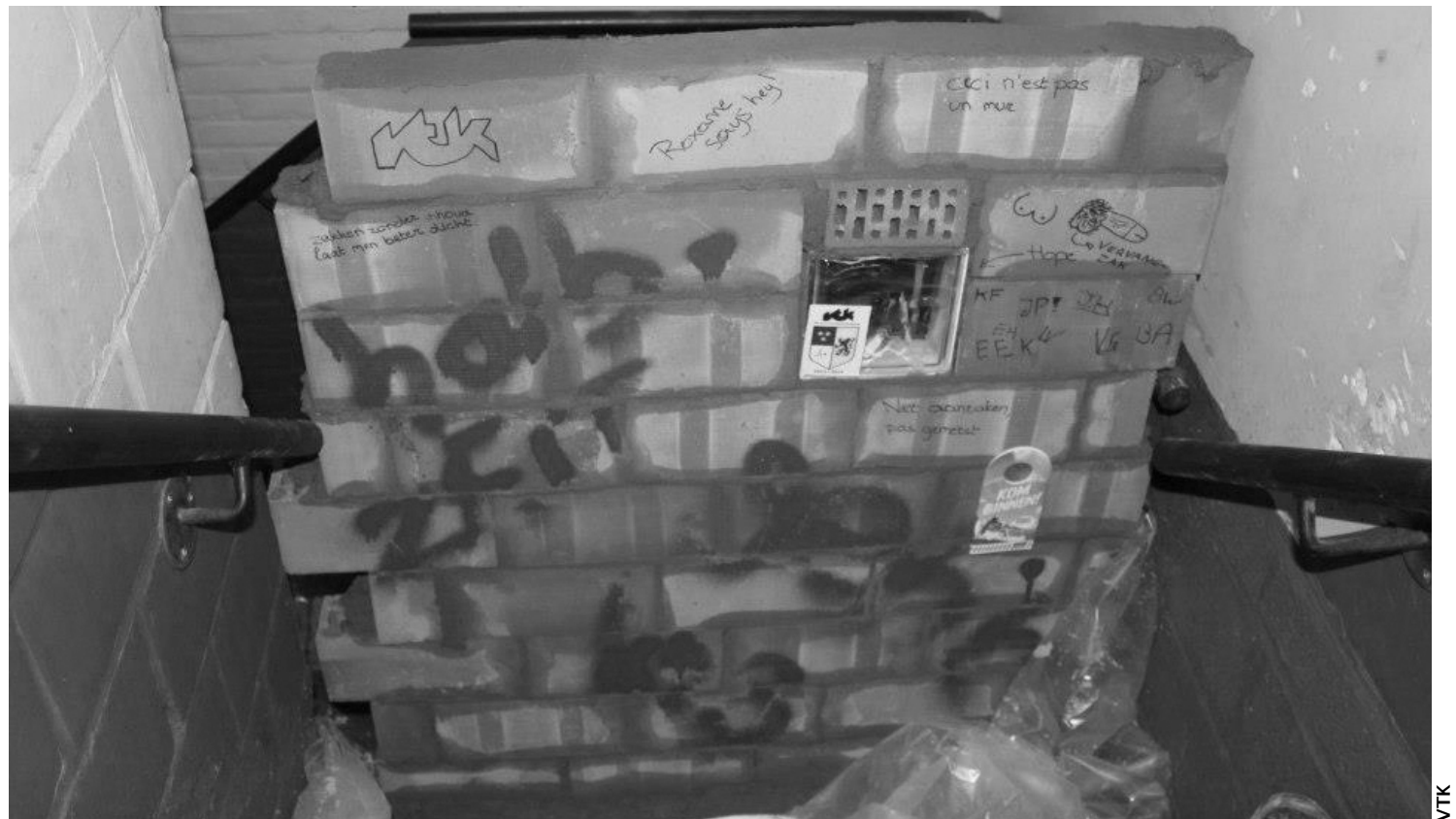
VTK metselde een muurtje aan de ingang van De Sportzak, de fakbar van Apolloon.