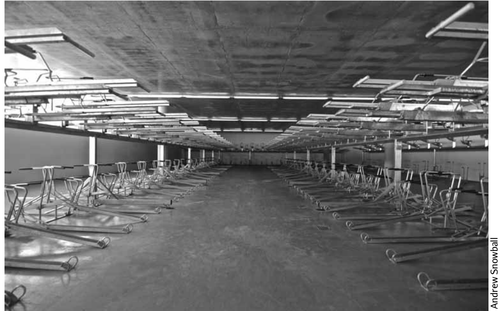
Er zijn wellicht populairdere fietsparkings dan die van het De Somerplein.

gemeenteraadsliden haar fiets uit de parking halen omdat die sloot. De burgemeester beschuldigde haar van leugens.”