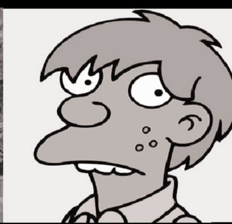
Seymour Skinner van Springfield